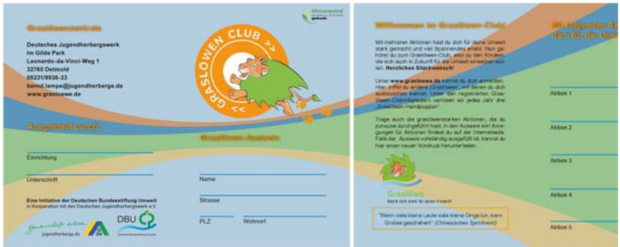
Der neue Graslöwen-Clubausweis.