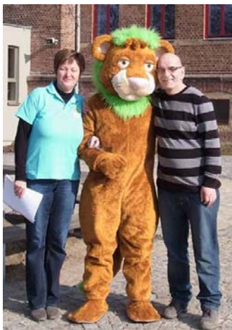
Der Graslöwe der Jugendherberge Strehla.

Von der Graslöwen-Plüschfigur bis zum Notensatz für das „Graslöwen-Musical“. Alle verfügbaren Graslöwen-Materialien sind über die Materialbestellliste meist kostenfrei zu bestellen. Eine Liste mit vorhandenen Materialien findet sich hier oder unter www.grasloewe.de . Zu besonderen Aktionen und Veranstaltungen kann der Verleih-Service für das Graslöwen-Maskottchen genutzt werden. Gegen Verpackung und Versand können Sie die Figur so lange nutzen, bis der nächste Bedarf anmeldet. Der Graslöwen Walking Act sorgt garantiert für gut gelaunte Umweltschützer. Ein eigener „Graslöwe“ kann für 2.490 € bestellt werden.