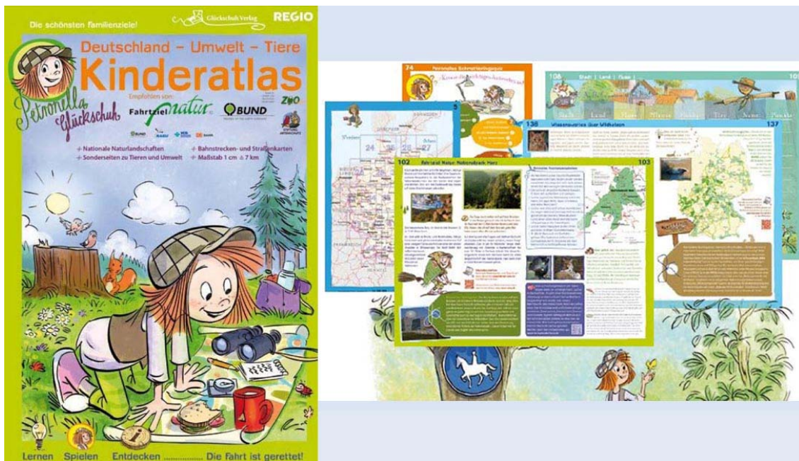
Im neuen Kinderatlas des Glückschuh Verlags gibt es viel Wissenswertes zu entdecken.

Mit dem Glückschuh Verlag hat der Graslöwe einen weiteren starken Partner gewonnen. Im neu erscheinenden Kinderatlas werden alle Graslöwen-Partner auf einer entsprechenden Karte dargestellt, die sich bis zum 1. Juli verpflichtend zur Graslöwen-Zertifizierung angemeldet haben! Das erfolgreiche Konzept wird vom Glückschuh Verlag in Zusammenarbeit mit dem Bund für Umwelt und Naturschutz (BUND) und Fahrtziel Natur umgesetzt. Anhand von zahlreichen Karten, Fotos und Abbildungen können Kinder viel Wissenswertes über Natur, Umwelt und Tiere erfahren.